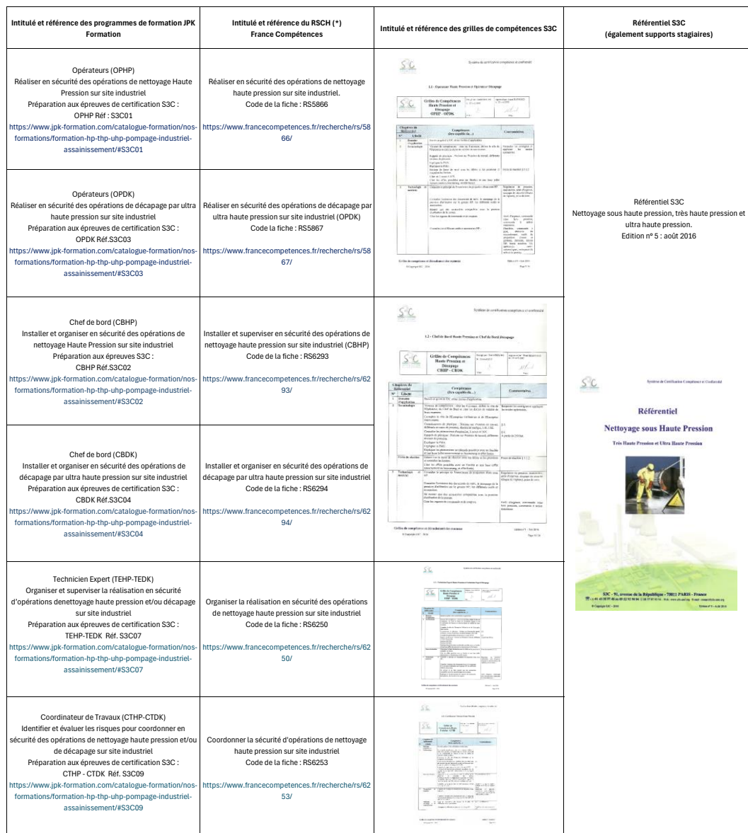
Tableau de concordances pour les formations à la préparation des certifications S3C Haute Pression (HP) et Décapage (DK) Très Haute Pression Ultra Haute Pression